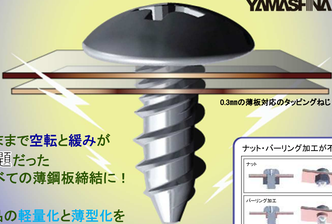
0.3mmの薄板対応のタッピングねじ